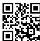
二俣川幼稚園ホームページ